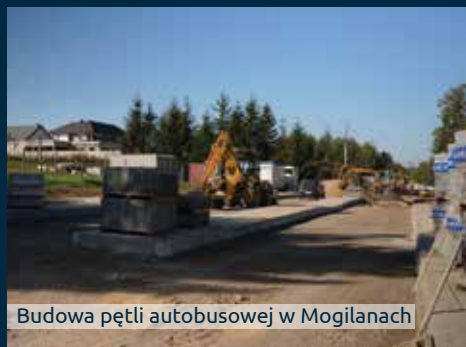
Budowa pętli autobusowej w Mogilanach