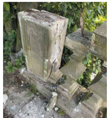
Zdewastowana rzeźba i balustrada