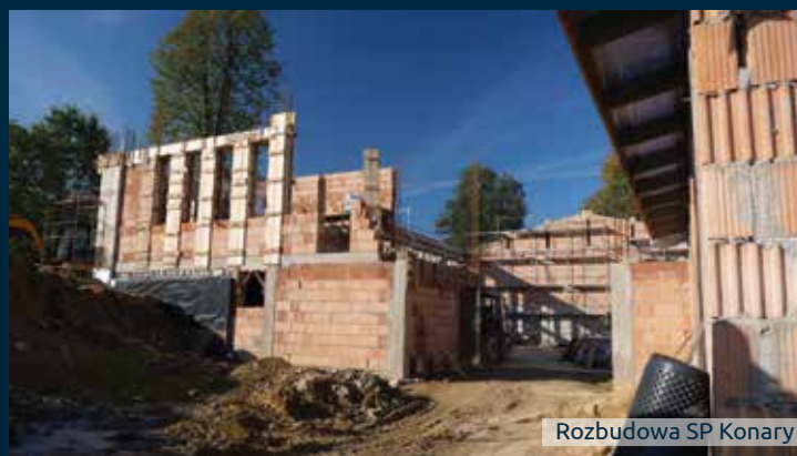
Rozbudowa SP Konary