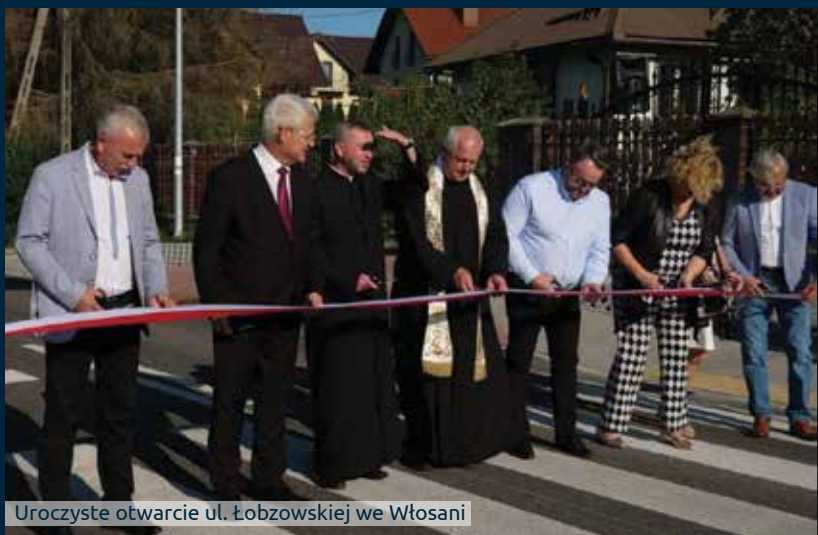
Uroczyste otwarcie ul. Łobzowskiej we Włosani