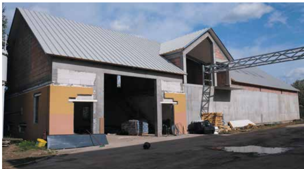
Oczyszczalnia ścieków w Lusinie