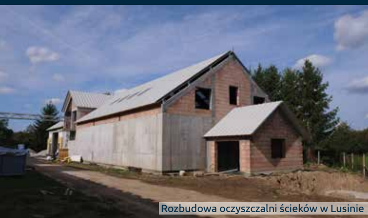
Rozbudowa oczyszczalni ścieków w Lusinie