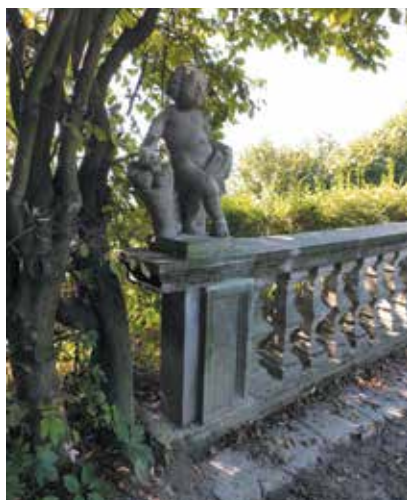
Balustrada i rzeźba amora po naprawie