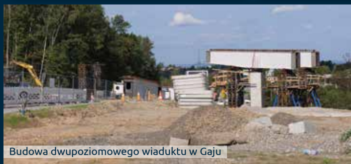
Budowa dwupoziomowego wiaduktu w Gaju