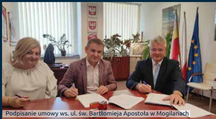
Podpisanie umowy ws. ul. św. Bartłomieja Apostoła w Mogilanach