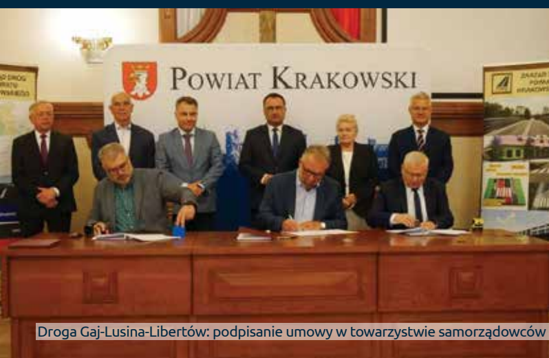
Droga Gaj-Lusina-Libertów: podpisanie umowy w towarzystwie samorządowców