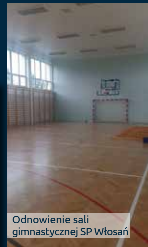
Odnowienie sali gimnastycznej SP Włosań