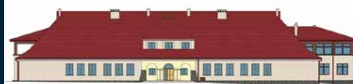
Plany rozbudowy i nadbudowy SP Libertów z dofinansowaniem