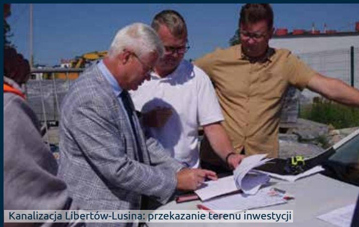
Kanalizacja Libertów-Lusina: przekazanie terenu inwestycji