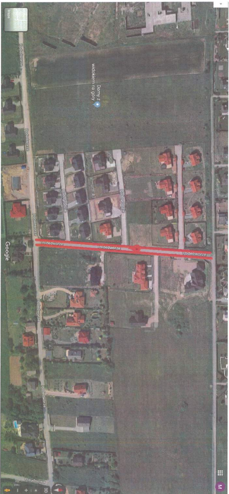
Załącznik nr 1. Poglądowy rzut terenu z oznaczeniem linią czerwoną odcinka ul. Podedworze